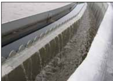
Betonrende med: KD 16.17 Flydeslamskant. KD 16.14 Hakkant.