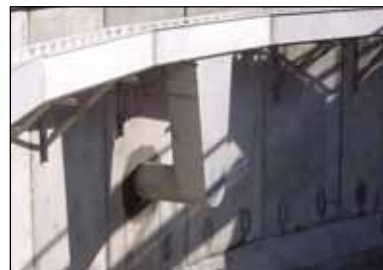
KD 16.18 rustfri afløbsrende med udløb.