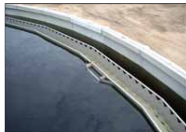
KD 16.08 Flydeslamsudtag, monteret direkte på KD 16.18 rustfri afløbsrende, hvor side mod centerdel virker som Flydeslamskant. Kan også monteres på KD 16.17 Flydeslamskant.