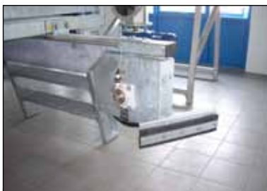
KD 16.10 Sneskraber.