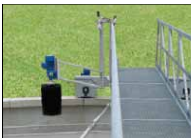
KD 16.11 Rendebørste.