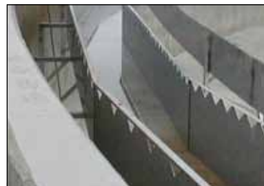
KD 16.18 rustfri afløbsrende med hakkant på begge sider, samt KD 16.17 Flydeslamskant.