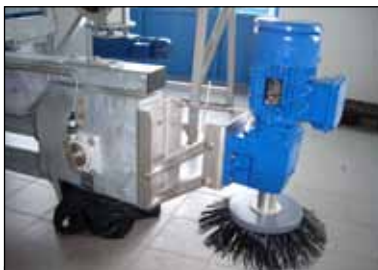
KD 16.19 Kørebane.