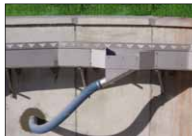
KD 16.08 Flydeslamsudtag, monteret direkte på KD 16.18 rustfri afløbsrende, hvor side mod centerdel virker som Flydeslamskant. Kan også monteres på KD 16.17 Flydeslamskant.